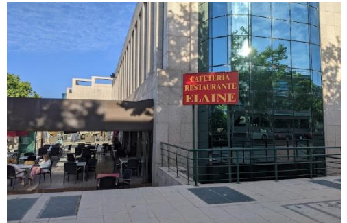
Restaurante Elaine (comidas y cenas)