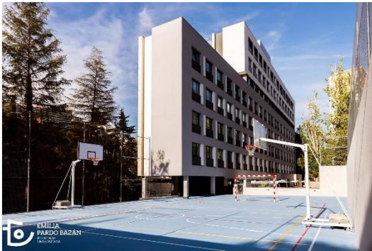
Fachada y cancha